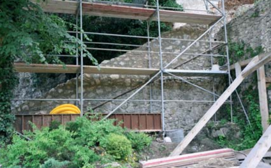
▲▼ Schody do Rajskej záhrady